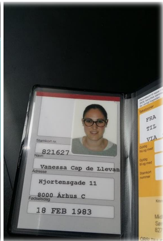
Bono de transporte público, coste aproximado 58 euros mensuales.