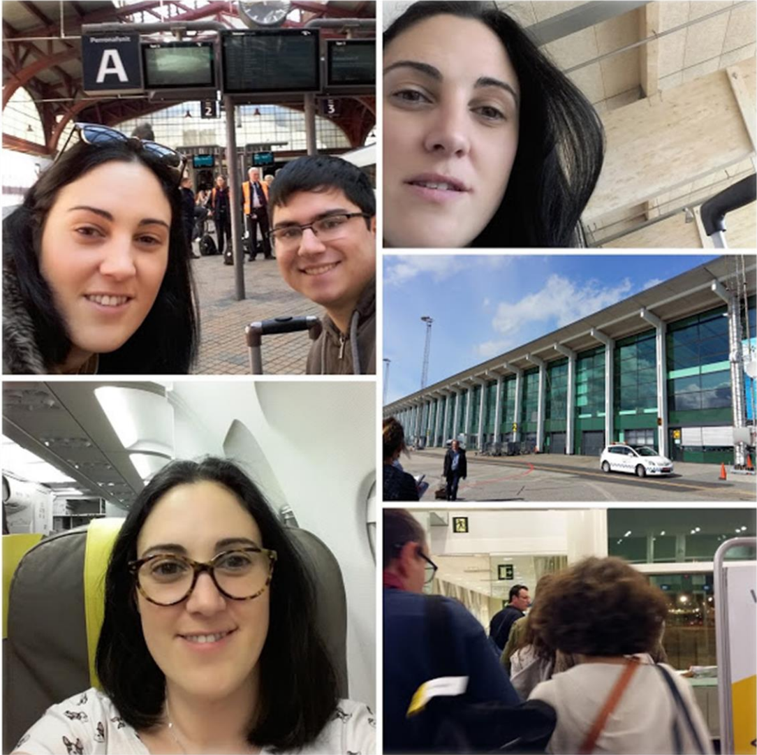
Aeropuerto del Prat, Aeropuerto de Aalborg y estación de tren de Aarhus.