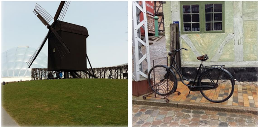
Alrededores del apartamento: DenGamleBy y el Jardín Botánico.

Una vez tengáis los billetes y el alojamiento el resto va rodado, pero a su vez tendréis que tramitar documentación como tarjeta sanitaria europea, carnet de estudiante internacional (que os lo recomiendo para ahorraros un dinerillo), certificado de antecedentes penales... en fin una serie de documentos que os serán necesarios.